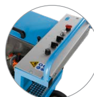
Panneau de commande bien structuré