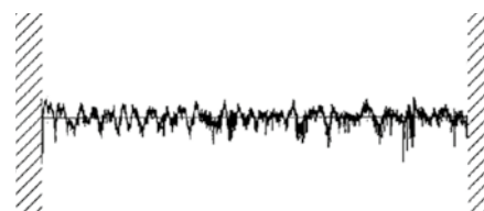
Super finition de surface R_a = 0,051