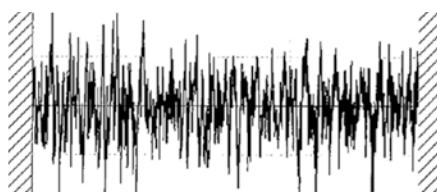
Rectification de finition de surface R_a = 0,223

Module 2,8 / Angle d'outil 20 / Nombre de dents 40 / Largeur de dent 34 mm