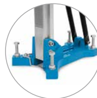
Base à cheviller compacte