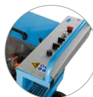
Panneau de commande bien structuré